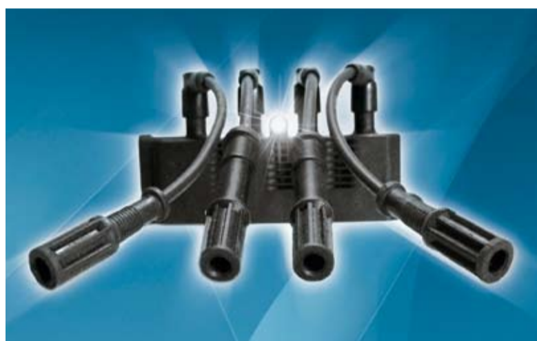
Un altro prodotto della gamma Brecav