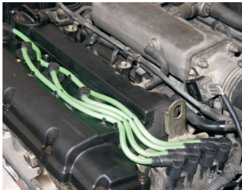
Nella gamma Brecav anche una linea dedicata al tuning