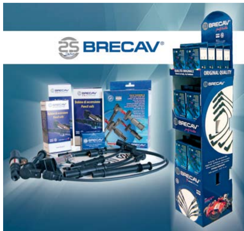
BrecaV si distingue anche per il packaging originale